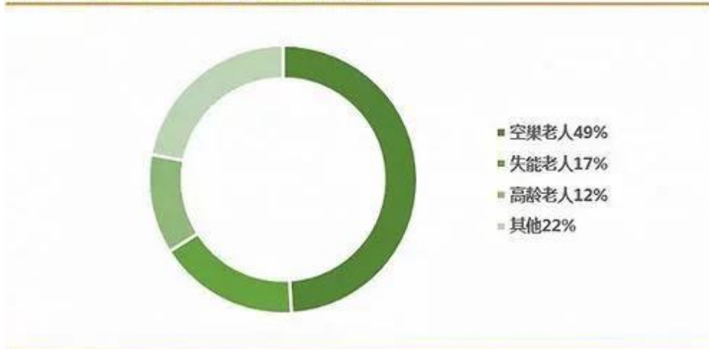
图 2: 2020 年中国老年人结构预测