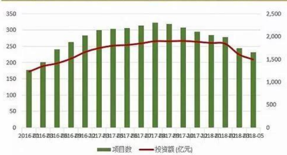
图 4：养老 PPP 项目数量（项目个数和金额均为累积数值）